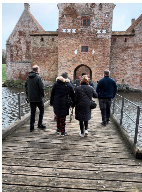
Mon der er spøgelser?