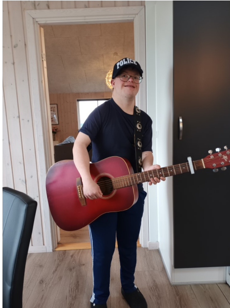
Er I klar til lidt rock og rul ...!!