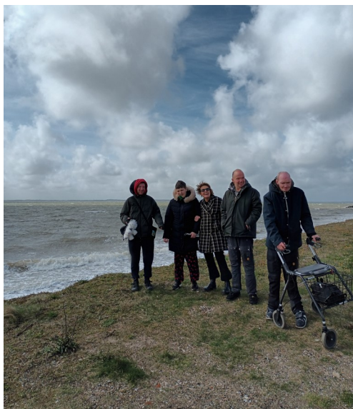
Dejligt med vind i håret