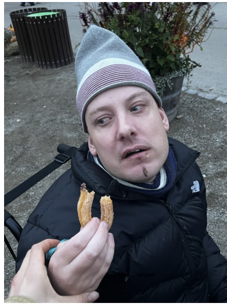
UHMmmm ... lækkert