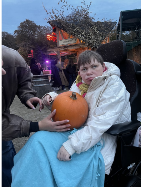
Sikkert flot græskar ....