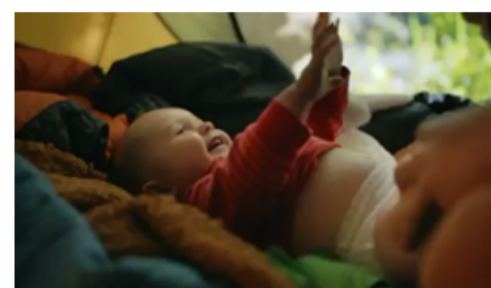
For din baby og miljøet

Skanderborg Kommune tager direkte kontakt til de borgere, der skal vaccineres som nu kan få vaccinationen tættere på hjemmet. bes