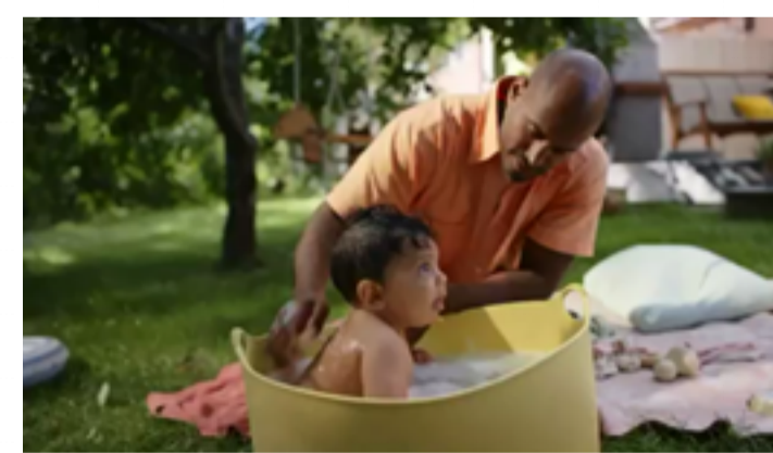
Tips til forældre!