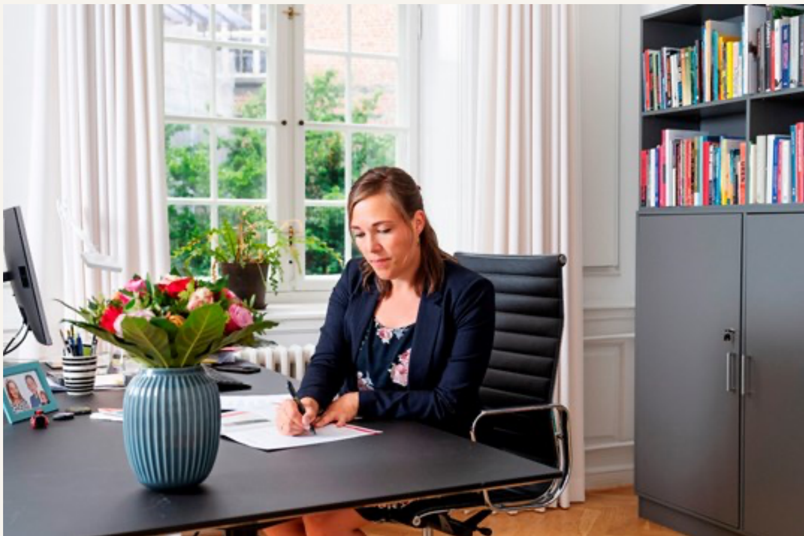
Socialminister Astrid Krag.