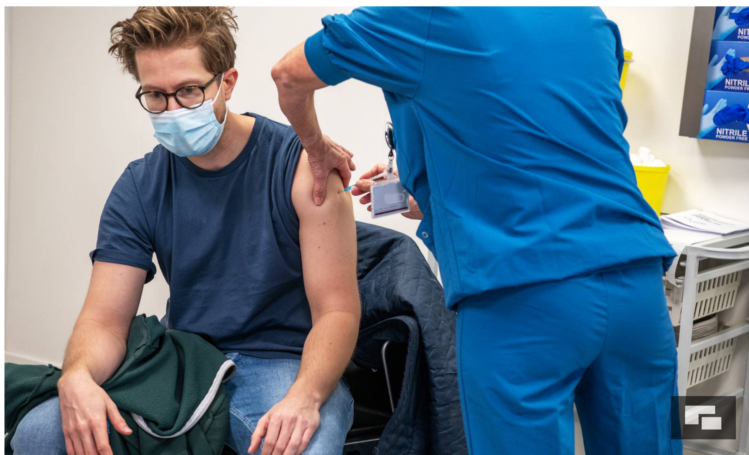
Sundhedsstyrelsen har inddelt danskerne i grupper og lagt en køreplan for, hvornår vi hver især skal vaccineres.

Sundhedsstyrelsen har offentliggjort en ny prognose for, hvornår danskerne kan blive vaccineret mod corona-virus.